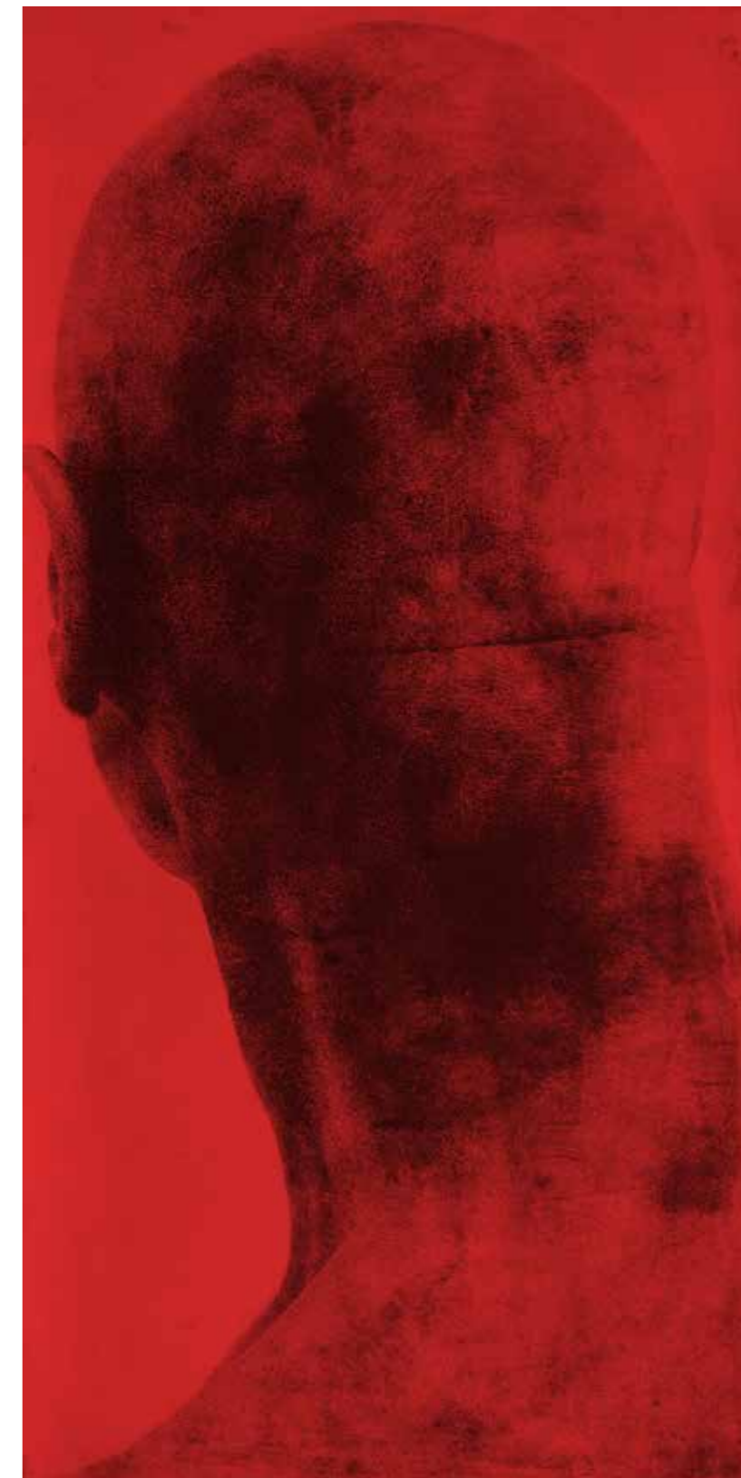
PIOTR SZUREK, INTAGLIO, 197-97 cm, 2021