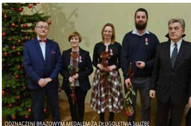
ODZNACZENI BRĄZOWYM MEDALEM ZA DŁUGOLETNIĄ SŁUŻBĘ