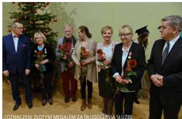
ODZNACZENI ZŁOTYM MEDALEM ZA DŁUGOLETNIĄ SŁUŻBĘ