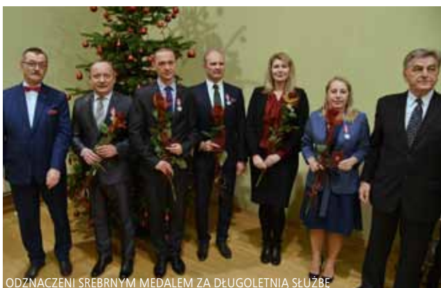
ODZNACZENI SREBRNYM MEDALEM ZA DŁUGOLETNIĄ SŁUŻBĘ