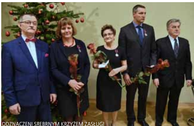
ODZNACZENI SREBRNYM KRZYŻEM ZASŁUGI