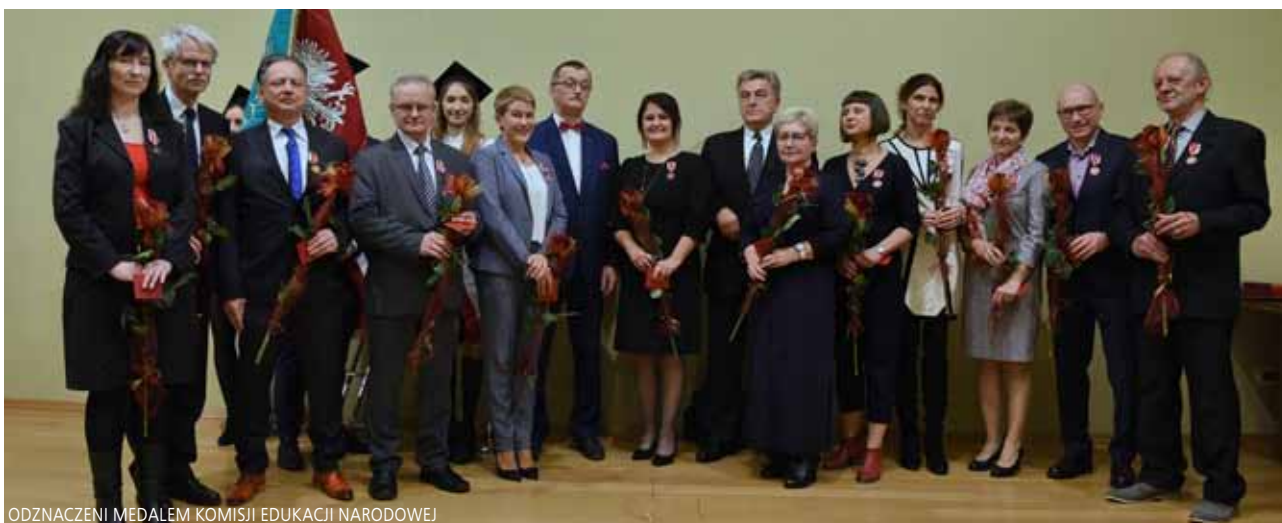
ODZNACZENI MEDALEM KOMISJI EDUKACJI NARODOWEJ