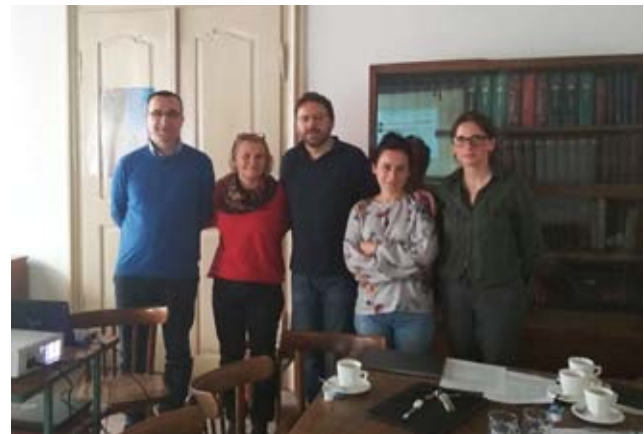
PRACOWNICY UNIWERSYTETU ZIELONOGÓRSKIEGO W CAMBRIDGE

W maju 2017 r. na Wydziale Pedagogiki, Psychologii i Socjologii została zorganizowana konferencja międzynarodowa Good Connections. Social Science and Divided Communities . Pracownia była zaangażowana w jej organizację, a szczególnie w powołanie do życia międzynarodowej, interdyscyplinarnej inicjatywy pod nazwą „Connectivity Center”. Współzałożycielami są nasi współpracownicy z kilku ośrodków (London