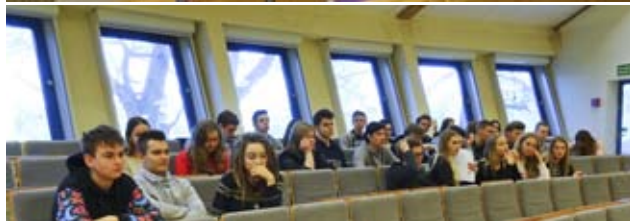
CYKL WYKŁADÓW NA WEZ