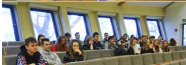
CYKL WYKŁADÓW NA WEZ