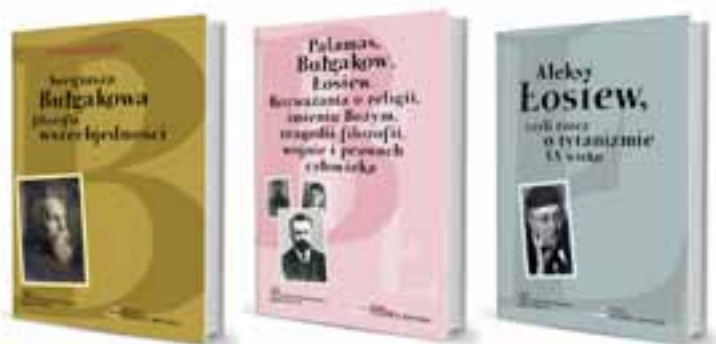
&gt; SERIA FILOZOFIA ROSYJSKA

mierz Sołowjow i jego czasy . Przez organy władzy nazwany wojującym mistykiem, teologiem Imienia Bożego, filozofem-szatanem mroku został w 1930 r. skazany na 10 lat pozbawienia wolności i zesłany do obozu. Zwolniony po kilku latach z powodu postępującej ślepoty, a następnie zrehabilitowany, pozostawał „podejrzany elementem”. Nie mógł wykładać filozofii, dlatego zajmował się estetyką, którą uważano za mniej niebezpieczną. Publikować na powrót zaczął dopiero po śmierci Stalina.