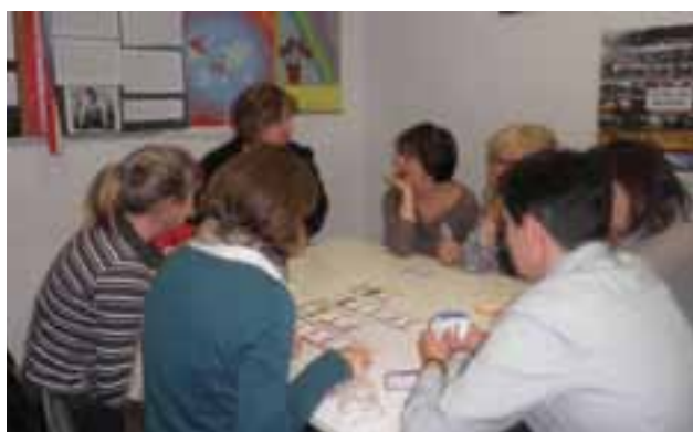
WIECZÓR GIER DYDAKTYCZNYCH BARDZO ZAINTERESOWAŁ UCZESTNIKÓW, TOTEŻ PIERWSZY DZIEŃ KONFERENCJI ZAKOŃCZYŁ SIĘ BARDZO PÓŹNO.