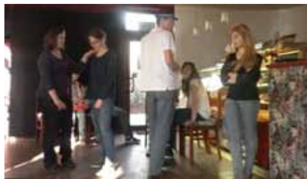
WARSZTATY TEATRALNE DLA STUDENTÓW I MŁODZIEŻY LICEALNEJ.