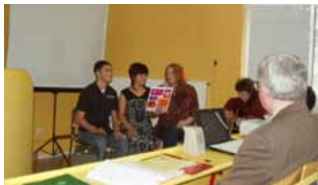
SURPRISE MUSICAŁE (NIESPODZIANKA MUZYCZNA) STUDENTÓW FILOLOGII ROMAŃSKIEJ NA POWITANIE GOŚCI.

27-29 marca 2012 r. - konferencja: Francophonie 2012: Langue, culture, éducation/Frankofonia 2012: Język, kultura, edukacja .