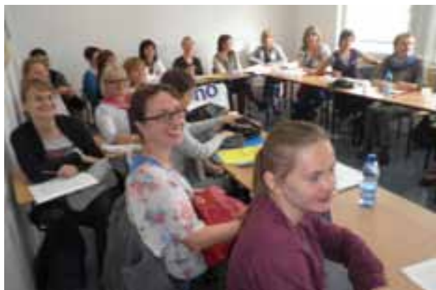
UCZESTNICY WARSZTATÓW LUDYCZNYCH UCZĄC SIĘ, ŚWIETNIE SIĘ BAWIĄ.