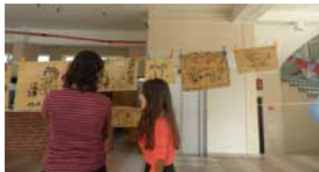
AFRYKAŃSKA TECHNIKA MALOWANIA TKANIN BOGOLAN