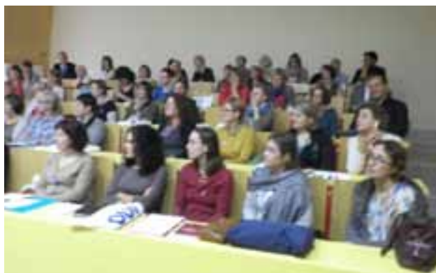
UCZESTNICY KONFERENCJI ZASLUCHANI I ZAINTERESOWANI WYSTĄPIENIAMI.