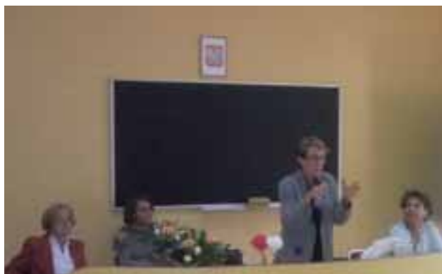
NA UROCZYSTYM ZAKOŃCZENIU KONFERENCJI ZASZCZYLIŁA NAS SWOJĄ OBECNOŚCIĄ MIREILLE CHEVAL, ATTACHÉE WSPÓŁPRACY EDUKACYJNEJ AMBASADY FRANCJI I KOORDYNATOR ALLIANCES FRANÇAISES W POLSCE.