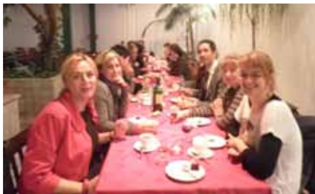
AK WIDAĆ, PO KOLACJI W UNIWERSYTECKIEJ PALMIARENCE, HUMORY WSZYSTKIM DOPISUJĄ...