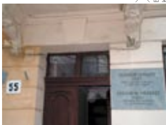
LWÓW - WEJŚCIE DO BUDYNKU W KTÓRYM MIESZKAŁA RODZINA POETY.