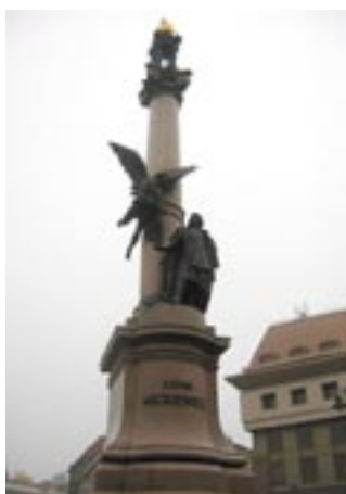
POMNIK WIEŻCZA WIE LWOWIE