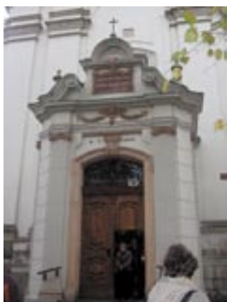
LWÓW - KOŚCIÓŁ POD WEZWANIEM ŚW. ANTONIEGO, GDZIE CHRZCZONY BYŁ ZBIGNIEW HERBERT.