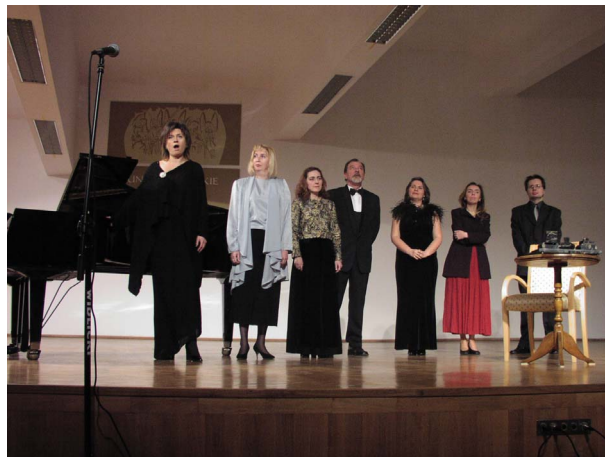
WSZYSCY WYKONAWCY GRUDNIOWEGO KONCERTU Z CYKLU „ARS LONGA” SĄ NAUCZYCIELAMI AKADEMICKIMI WYDZIAŁU ARTYSTYCZNEGO