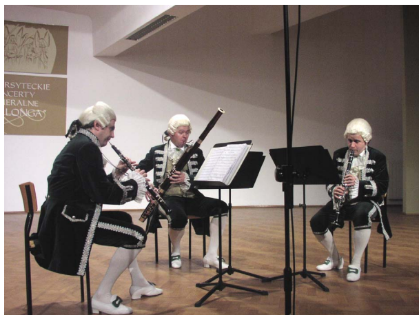
POZNAŃSKIE TRIO STROIKOWE