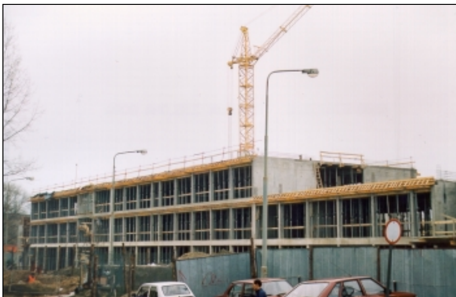
BUDOWANY OBIEKT WYDZIAŁU NAUK ŚCISŁYCH SIĘGNĄŁ JUŻ TRZECIEJ KONDYGNACJI