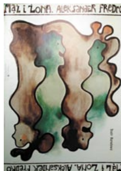
JAN LENICA, MĄŻ I ŻONA - ALEKSANDER FREDRO, PLAKAT TEATRALNY, 1977

ki łączeniu tradycji z nowoczesnością, dawnych zbiorów z nowymi, najnowszych technik informacyjnych z metodami tradycyjnymi. Nowe technologie umożliwiają czytelnikom elektroniczny dostęp do zbiorów, doskonałe kopie i reprodukcje multimedialne, pozwalają łatwo korzystać ze światowych zasobów informacyjnych. Nie zastąpią jednak bezpośrednich kontaktów z twórcami i ich dziełami. I jeżeli fachowa literatura będzie miała raczej ściśle określony krąg odbiorców, to literatura, kultura i sztuka bliskie są wszystkim. W czasach powszechnego internetu ważne stało się nie tylko organizowanie dostępu do zasobów wiedzy czy kultury, ale też pielęgnowanie i upowszechnianie tych form działalności, które umożliwiają odbiorcom bezpośredni kontakt z twórcami i ich dziełami. W repertuarze możliwości Biblioteki Uniwersyteckiej i Biblioteki Sztuki leży szereg takich działań.