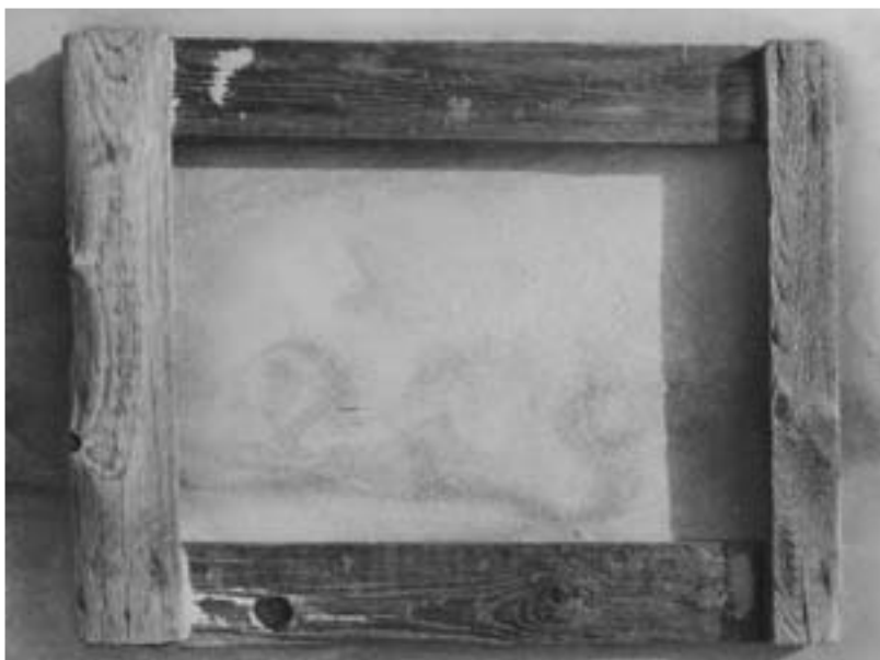
ALYDAS LUKYS, THING FROM THE SEE, 1984, FOT. OPARTA NA SREBRZE 17.7 X 12.5

Artoteka Fotografii działająca przy Bibliotece Uniwersyteckiej zakłada tworzenie kolekcji, kompletowanie księgozbioru, dokumentacji fotograficznej oraz działań z udziałem twórców. Chcemy nie tylko zachować ślad fotografii, ale także zapoznać środowisko z problemami i teorią fotografii współczesnej 6 .