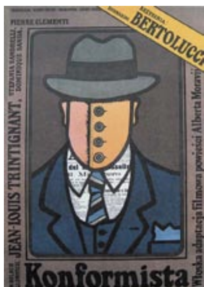
JAN MŁODOŻENIEC, KONFORMISTA - BERNARDO BERTOLUCCI, PLAKAT FILMOWY