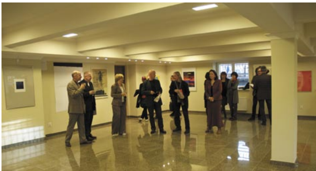
PIERWSZY WERNISZAŻ W GALERII UNIWERSYTECKIEJ, 7 PAŹDZIERNIKA

W ostatnich latach biblioteki naukowe stanęły przed szeregiem wyzwań wynikających z wielu potrzeb i oczekiwań użytkowników o bardzo różnorodnych i wygórowanych wymaganiach. Rolą biblioteki stało się nie tylko organizowanie warsztatów pracy i wspieranie dydaktyki, ale także popularyzowanie działalności naukowej i artystycznej własnego środowiska, organizowanie dostępu do myśli, dzieł i pracy twórczej innych. Biblioteki jako istotny element całego organizmu uniwersyteckiego współtworzą kulturalne środowisko jej uczestników. Gromadzone przez nią dobra są świadectwem wiedzy i kultury, potwierdzeniem narodowej tożsamości, dziedzictwa kulturowego, osiągnięć cywilizacyjnych. Walorem bibliotek stała się nie tylko różnorodność i wielostronność gromadzonych przez nią zbiorów, ale także ich szeroka prezentacja. Jest to możliwe dzięki