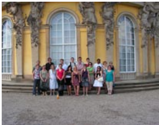
UCZESTNICY SPOTKANIA PODCZAS ZWIEDZANIA PAŁACU SANSOUCCI, 25 VII 2008