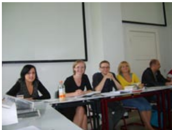
W TRAKCIE WYKŁADÓW

Pomysłodawcą i koordynatorem międzynarodowego projektu jest Uniwersytet w Poczdamie. Wpisuje się on w bardzo popularny obecnie nurt badań nad oświeceniem jako przełomowym prądem epoki nowożytnej,