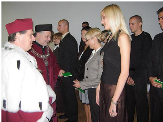
IMMATRYKULACJA STUDENTÓW I ROKU Z WYDZIAŁU NAUK PEDAGOGICZNYCH I SPOŁECZNYCH.