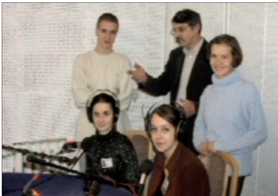
OSTATNIE UWAGI NACZELNEGO PRZED WEJŚCIEM NA ANTENĘ

M. B.: „Powrót” to jest sztuka o trudzie emocjonalnego powrotu do miejsc, które