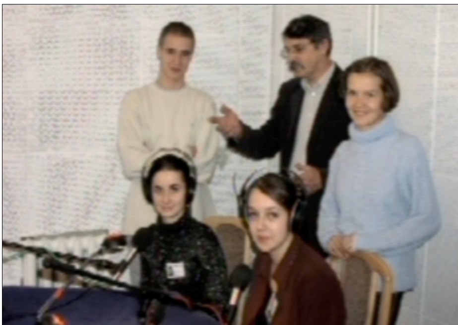
OSTATNIE UWAGI NACZELNEGO PRZED WEJŚCIEM NA ANTENĘ

M. B.: „Powrót” to jest sztuka o trudzie emocjonalnego powrotu do miejsc, które