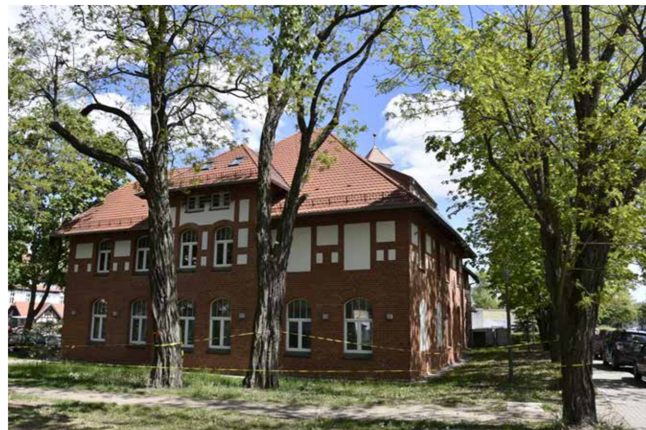
FOT. MAMERT JANION