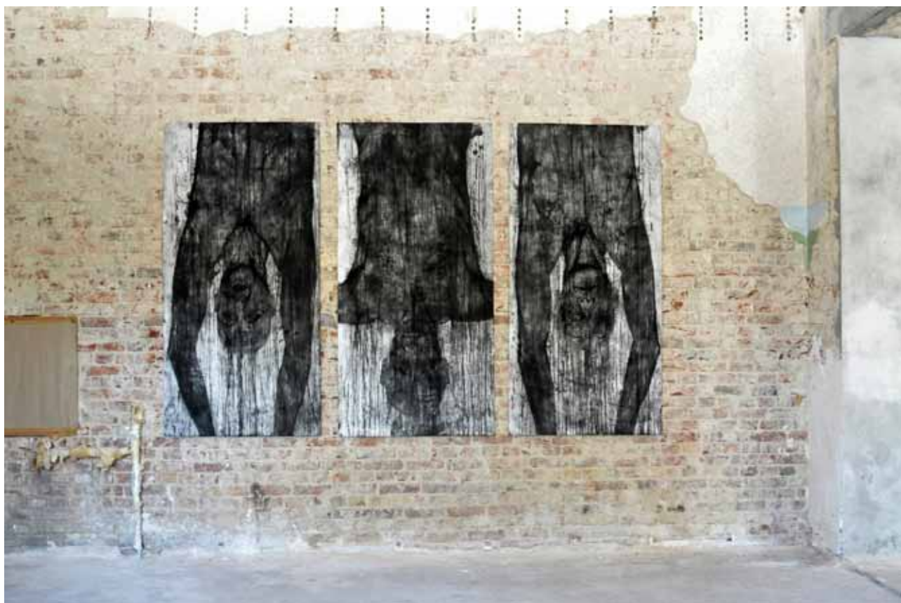
PIOTR SZUREK „AUTOPORTRET”, TRYPTYK, 3 X 200X100 CM. TECHNIKA: INTAGLIO