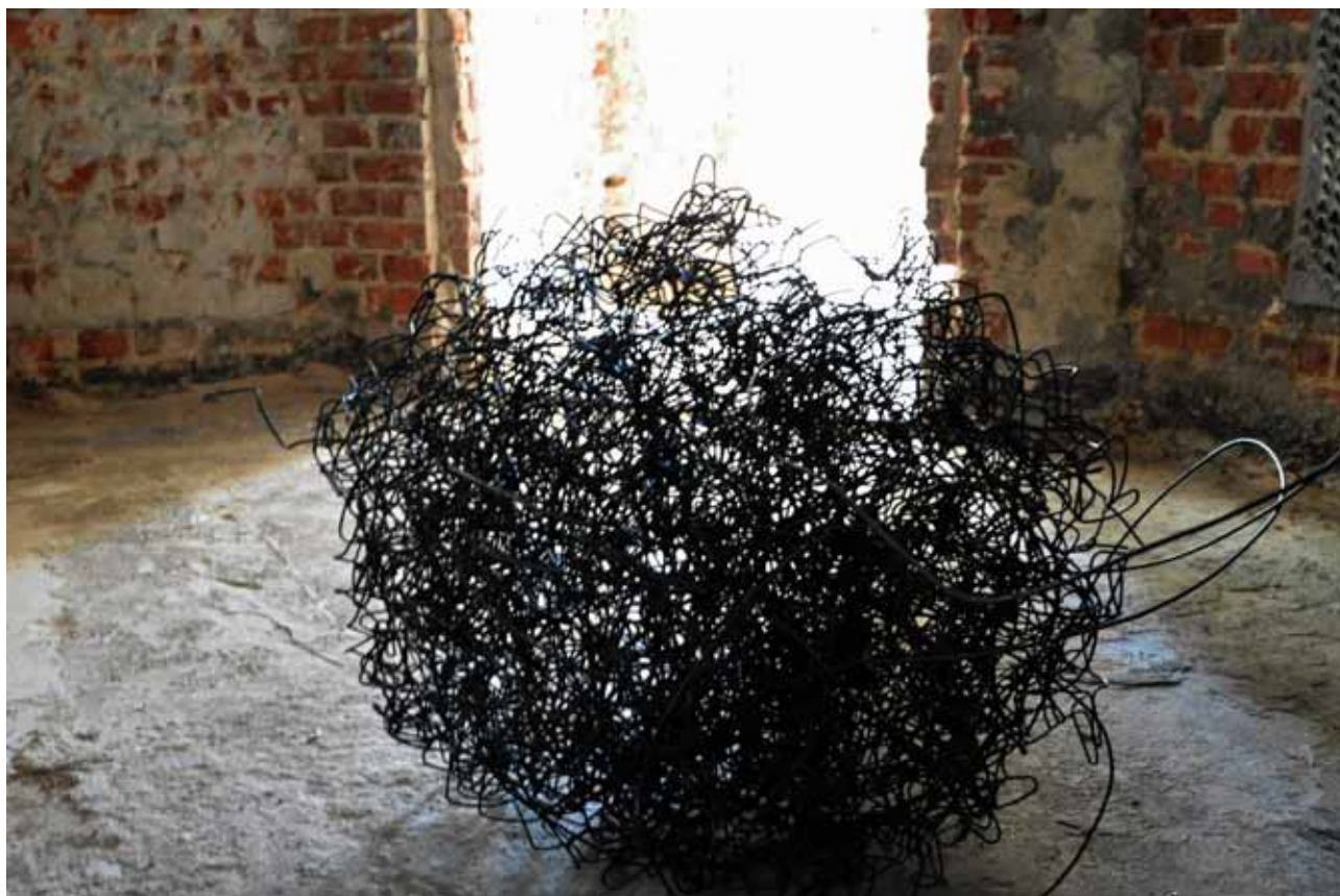
MARYNA MAZUR, OBIEKT Z CYKLU: „TEREN PRYWATNY”, FRAGMENT WYSTAWY PT. „GRANICE TERENU PRYWATNEGO”