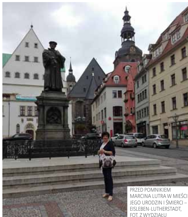
PRZED POMNIKIEM MARCINA LUTRA W MIEŚCIE JEGO URODZIN I ŚMIERCI – EISLEBEN-LUTHERSTADT