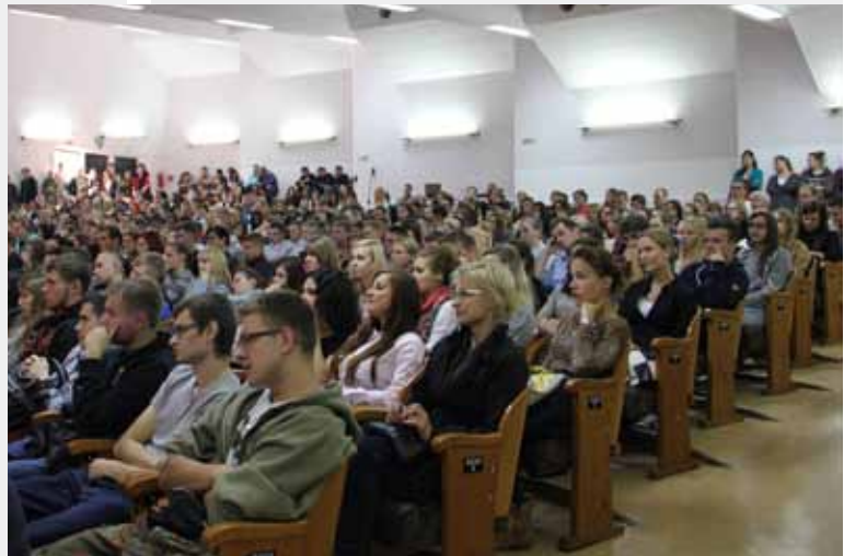
UCZESTNICZY INAUGURACJI ROKU AKADEMICKIEGO NA WYDZIALE EKONOMII I ZARZĄDZANIA (FOT. M. RATAJCZAK-GULBA)