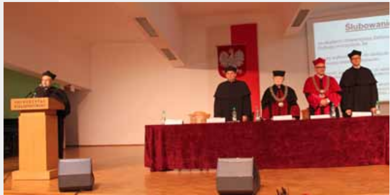
ŚLUBOWANIE NOWO PRZYJĘTYCH STUDENTÓW