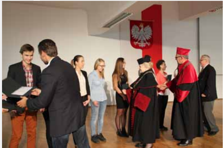
GRATULACJE STUDENTOM SKŁADAJĄ WIAADZE UCZELNI W WYDZIALE ORAZ RADNI