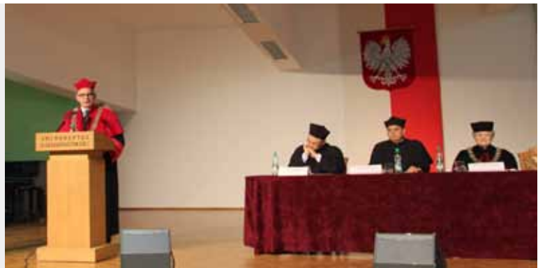
WYSTĄPIENIE INAUGURACYJNE PROREKTORA DS. STUDENCKICH PROFESORA WOJCIECHA STRZYŻEWSKIEGO