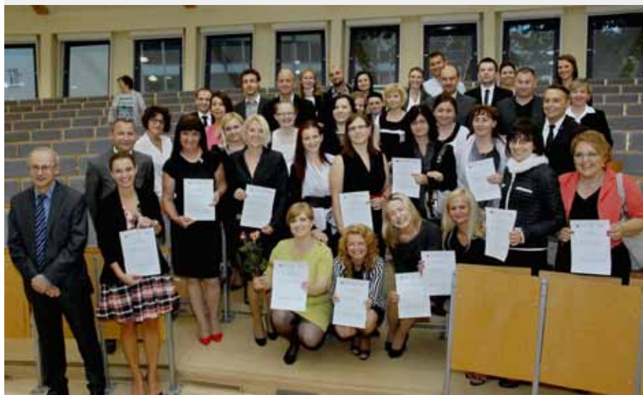
ABSOLWENCI V EDYCJI STUDIÓW PODYPLOMOWYCH

zajęć (wykładów i ćwiczeń). W ramach każdego spotkania przewidziany jest komentarz aktualnych wydarzeń ekonomicznych (w wymiarze krajowym i międzynarodowym) wpływających na zachowania rynków finansowych i gospodarki. Ponadto zajęcia będą wzbogacane o szczegółową analizę case study oraz animowaną przez prowadzącego zajęcia dyskusję pomiędzy uczestnikami zajęć. Planowane są również wykłady gościnne. Studia będą trwały od października 2014 r. do czerwca 2015 r.