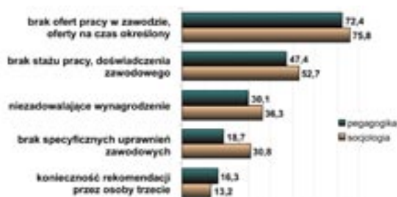
Wykres 2. Czynniki utrudniające otrzymanie pracy

Wskazując czynniki pomocne w otrzymaniu pracy poza formalnym wykształceniem bardzo często wskazywano przypadek i zbieg okoliczności, rekomendacje osób trzecich, czyli to, na co absolwent nie ma wpływu. Podkreślano też rangę dodatkowych kompetencji i gotowości do kształcenia się oraz uporu w poszukiwaniu pracy.