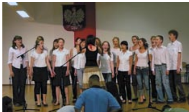
NOWY POMYSŁ: SZALONE KARAOKE