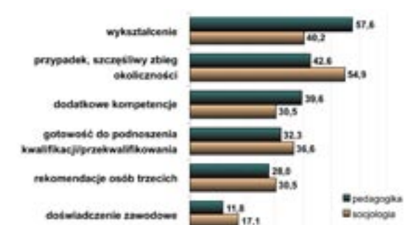
Wykres 3. Czynniki ułatwiające otrzymanie pracy

O poziomie uczelni i zadowoleniu jej absolwentów z otrzymanego wykształcenia świadczy, wśród wielu innych czynników, gotowość rekomendowania uczelni, czy wydziału innym. Zadano uczestnikom badań pytanie: Czy poleciliby studia na UZ innym? Uzyskane odpowiedzi można uznać za zadawalające. Większości byłych studentów, szczególnie pedagogów skłonna jest polecić naszą uczelnię innym jako miejsce do studiowania (77,1% pedagogika; 55,1% socjologia) choć są to najczęściej odpowiedzi mniej zdecydowane (raczej tak). Jednak jeśli dodać, że większość badanych, zwłaszcza pedagogów, deklaruowała także zadowolenie z wyboru uczelni i kierunku studiów to władze wydziału i uczelni mogą mieć powód do satysfakcji. Oczywiście należy dążyć do takiej poprawy oferty i warunków kształcenia, aby wszyscy studenci byli ambasadorami uczelni w przyszłości.