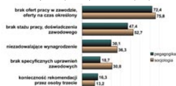
Wykres 2. Czynniki utrudniające otrzymanie pracy

Wskazując czynniki pomocne w otrzymaniu pracy poza formalnym wykształceniem bardzo często wskazywano przypadek i zbieg okoliczności, rekomendacje osób trzecich, czyli to, na co absolwent nie ma wpływu. Podkreślano też rangę dodatkowych kompetencji i gotowości do kształcenia się oraz uporu w poszukiwaniu pracy.