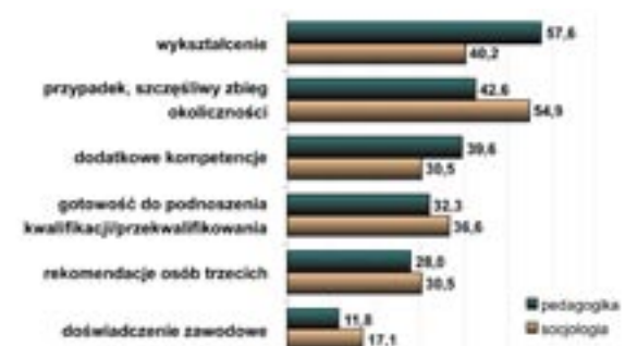
Wykres 3. Czynniki ułatwiające otrzymanie pracy

O poziomie uczelni i zadowoleniu jej absolwentów z otrzymanego wykształcenia świadczy, wśród wielu innych czynników, gotowość rekomendowania uczelni, czy wydziału innym. Zadano uczestnikom badań pytanie: Czy poleciliby studia na UZ innym? Uzyskane odpowiedzi można uznać za zadawalające. Większości byłych studentów, szczególnie pedagogów skłonna jest polecić naszą uczelnię innym jako miejsce do studiowania (77,1% pedagogika; 55,1% socjologia) choć są to najczęściej odpowiedzi mniej zdecydowane (raczej tak). Jednak jeśli dodać, że większość badanych, zwłaszcza pedagogów, deklaruowała także zadowolenie z wyboru uczelni i kierunku studiów to władze wydziału i uczelni mogą mieć powód do satysfakcji. Oczywiście należy dążyć do takiej poprawy oferty i warunków kształcenia, aby wszyscy studenci byli ambasadorami uczelni w przyszłości.