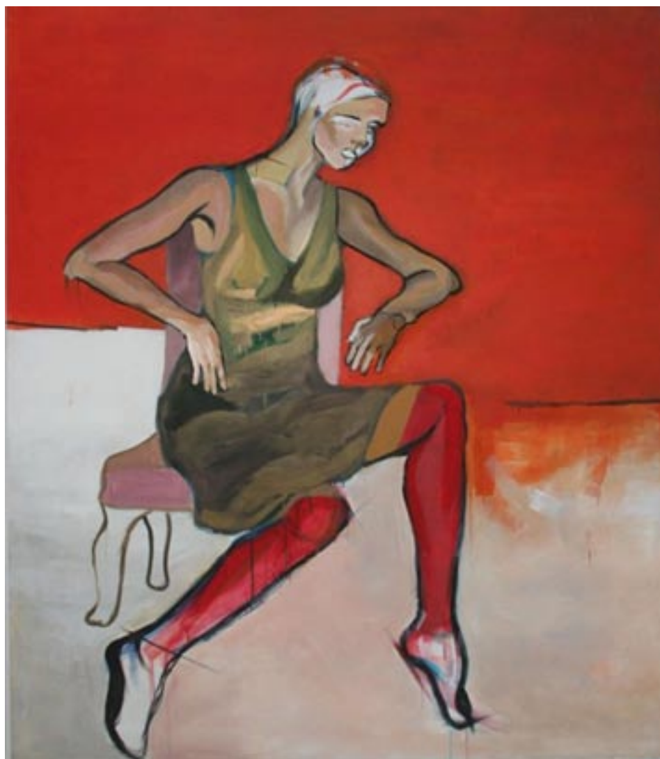
JUSTYNA KACZOR MALARSTWO