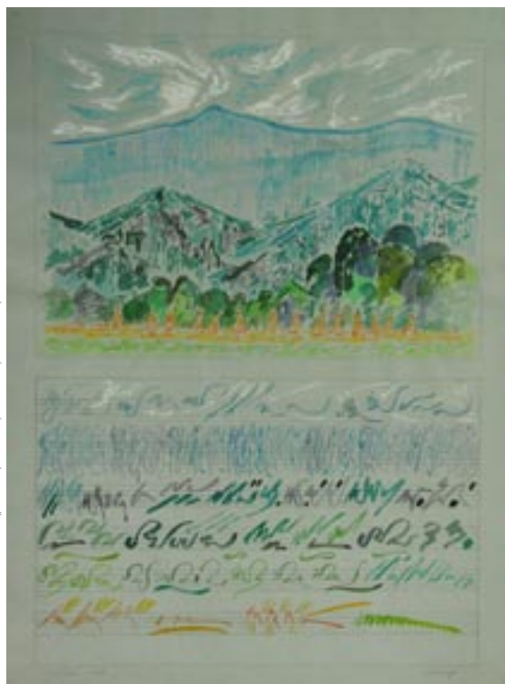
JANINA KRAUPE-ŚWIDERSKA „ŻNIWA”, 1986 R., WYM. 63,8 X 47 CM., AKWARELA

Janina Kraupe-Świderska (ur. w 1921) uprawia malarstwo, grafikę i rysunek. W roku 1938 rozpoczęła studia w Akademii Sztuk Pięknych w Krakowie. W latach 1938-