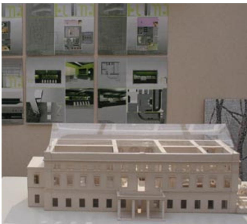
PRACOWNIA ARCHITEKTURY WNIĘTRZ