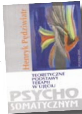
Pędziwiatr, H., Teoretyczne podstawy terapii w ujęciu psycho- somatycznym, s. 280, oprawa broszurowa, A5, Oficyna Wydawnicza UZ, 2006

„Współczesna nauka, z mnogością kierunków podejmowanych badań nad zdrowiem i chorobą czło-