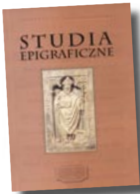
Studia Epigraficzne, t. 2, red. J. Zdrenka, s. 214, oprawa broszurowa, A5, Oficyna Wydawnicza UZ, 2006

„Kolejny, drugi tom Studiów Epigraficznych zawiera prace stanowiące głównie pokłosie III Ogólnopolskiej Konferencji Epigraficznej, która odbyła się 13 października 2004 roku w Zielonej Górze. Szeroki udział młodszego pokolenia historyków świadczy o ciągle rosnącym zainteresowaniu tematyką epigraficzną w Polsce, co bardzo cieszy. Planowanych konferencji dwudniowych, nie udało się dotychczas przeprowadzić ze względów finansowych. Organizatorzy wyrażają jednak nadzieję, że rosnące zainteresowanie tą tematyką przyczyni się w przyszłości do pokonania i tych trudności.