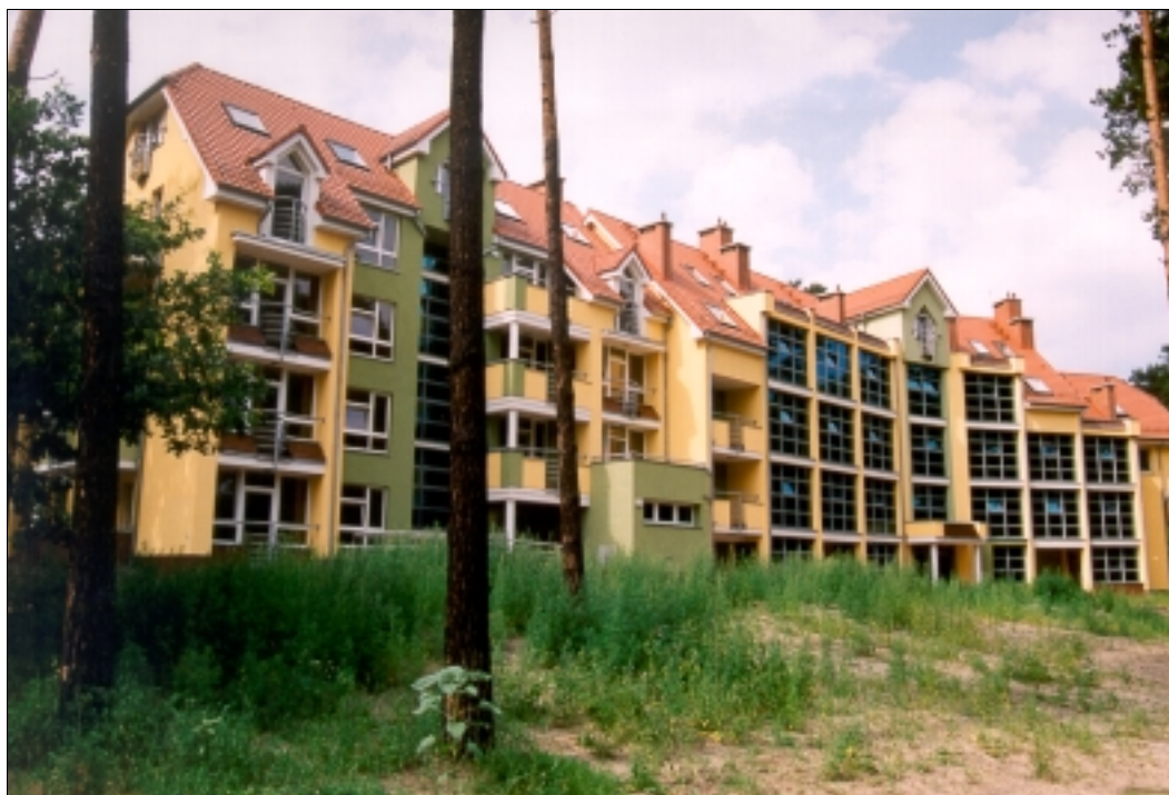
W NOWYM AKADEMIKU PRZY UL. WYSPIAŃSKIEGO ZAMIESZKA 210 STUDENTÓW I ASYSTENTÓW

szkoły. Posiada również własną redakcję wydawnictw. Rektora wspierają także dwaj prorektorzy