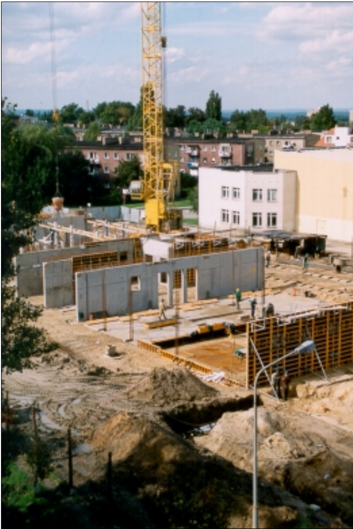
OBIEKT WYDZIAŁU NAUK ŚCISŁYCH WYSZEDŁ JUŻ Z ZIEMI

„resortowi” – ds. Nauki i Współpracy z Zagranicą oraz ds. Studenckich. Jednostkami administracji ekonomicznej i gospodarczej kieruje dyrektor administracyjny przy pomocy trzech zastępców - ds. ekonomicznych, finansowych (kwestor) i technicznych. Administracji pionu rektora przewodzi dyrektor jego biura. Ilustrują to przedstawione schematy organizacji działalności naukowo-dydaktycznej oraz administracyjno-gospodarczej. Rok akademicki w uniwersytecie rozpocznie 23.178 studentów, z czego 10.420 na studiach dziennych. Na ośmiu wydziałach studia prowadzone są na 23 kierunkach: