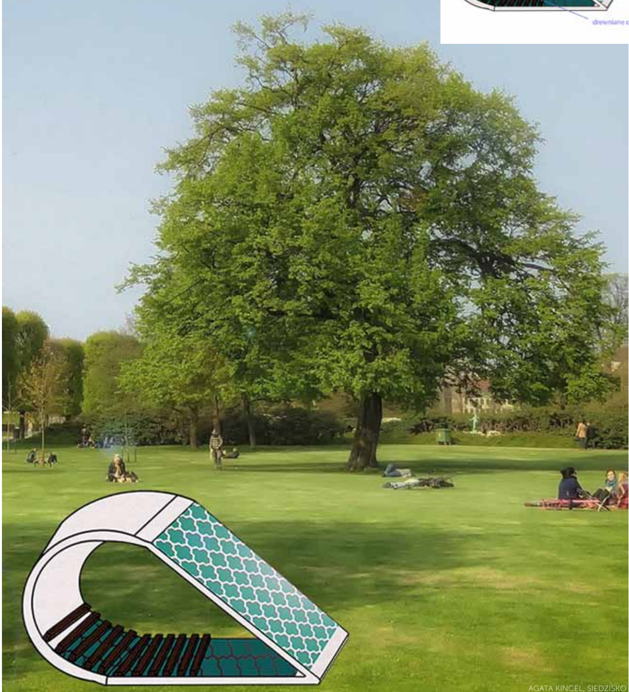
AGATA KINCEL, SIEDZISKO