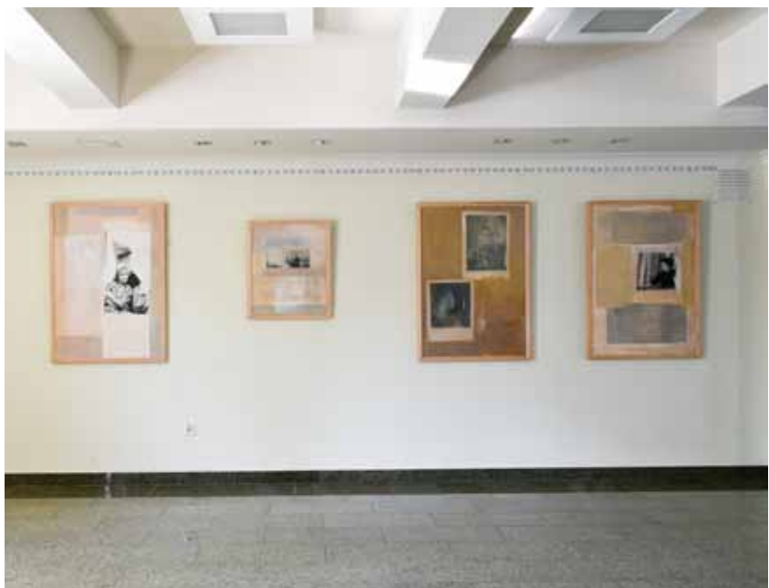
WIDOK WYSTAWY, FOT. MAREK LALIKO