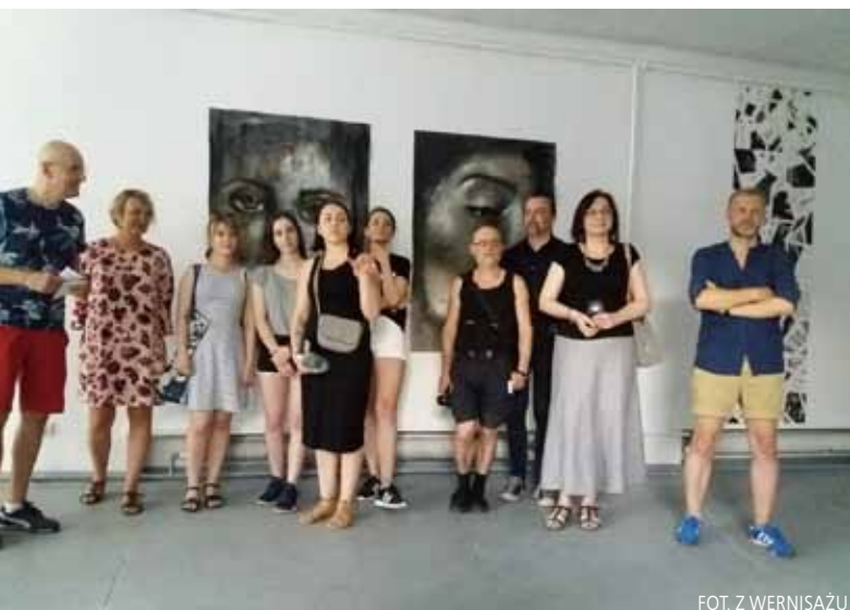
FOT. Z WERNISAŻU