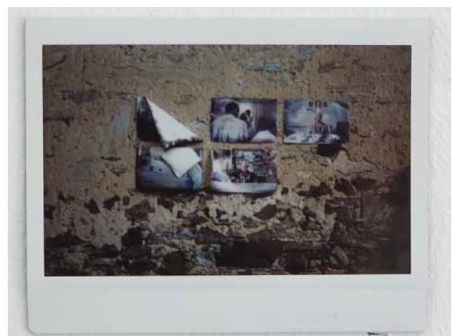
PRACA Z WYSTAWY „UCZESTNICY”, FOT. JAREK JESCHKE

Pracownia powstała w 2002 roku. Jest jedną z trzech Pracowni Rysunku i Intermediów prowadzonych w Instytucie Sztuk Wizualnych UZ. Tworzą ją studenci wszystkich kierunków. Od II roku studiów licencjackich podlega ona