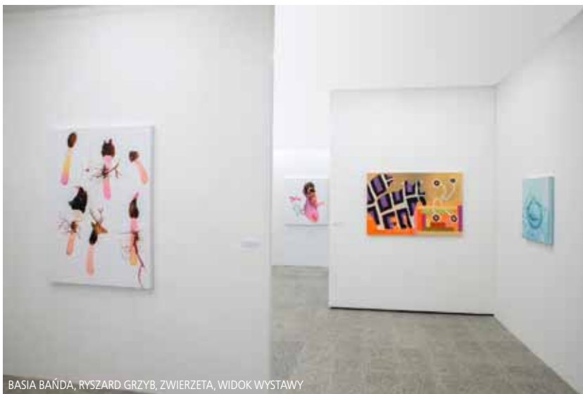
BASIA BAŃDA, RYSZARD GRZYB, ZWIERZĘTA, WIDOK WYSTAWY

i emocjonalne w publicznej scenerii wystawy. W tym etapie powstały następujące cykle: