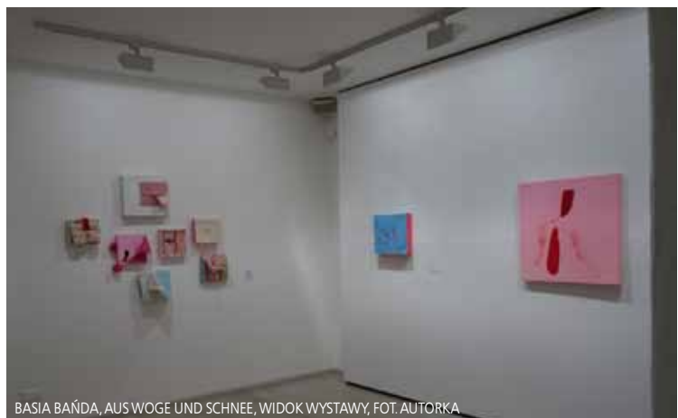
BASIA BAŃDA, AUS WOGUE UND SCHNEE, WIDOK WYSTAWY

Basia Bańda / Ryszard Grzyb, Zwierzęta , Wizytująca Galeria, Warszawa, 18.05-14.06.2017