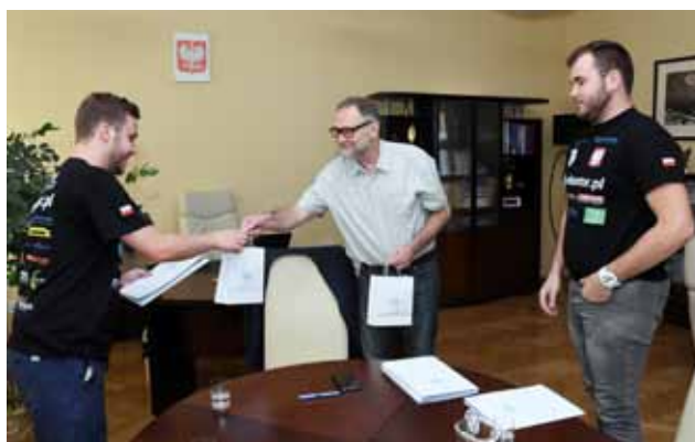
PODRÓŻNICZY ODEBRALI GRATULACJE OD WICEMARSZAŁKA UNIWERSYTETU

Uczestnicy wyprawy podkreślają, że była to największa podróż ich życia, ale nie ostatnia. Tak wielka wyprawa działa inspirująco i mobilizująco. Przed młodymi podróżnikami kolejne wyzwania. Za ich realizację wzięli się od razu po powrocie. Co to takiego? Z pewnością dowiemy się niebawem. mm