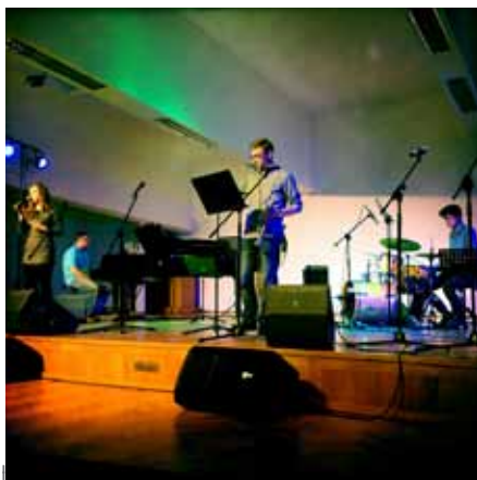
FOT. ARTUR MAJEWSKI