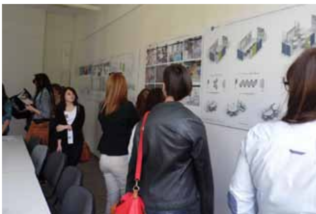
WYBRANE PLANSZE PREZENTUJĄCE PROJEKTY