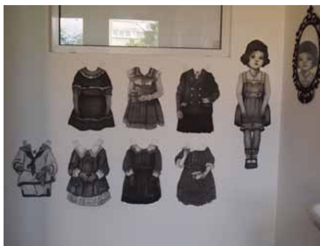
PRACA MAŁGORZATY REKUSZ, ABSOLWENTKI Z PRACOWNI PROF. PIOTRA SZURKA (TECH. AKWATINTA)