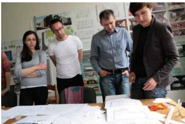
RELACJA ZDJĘCIOWA Z WARSZTATÓW

Zatem design modułów mebli i aranżacje wnętrz powinny spełniać oczekiwania zarówno potencjalnych pracowników - wskazanej w briefie projektowym Generacji Y, jak również spełniać wymogi biznesu i potencjalnych klientów, czyli pracodawców. Zastosowanie optymalnych rozwiązań designerskich dla przestrzeni współpracy miało stworzyć kilka opcji aranżacji wnętrz dla grup 4-8-osobowych, ana-