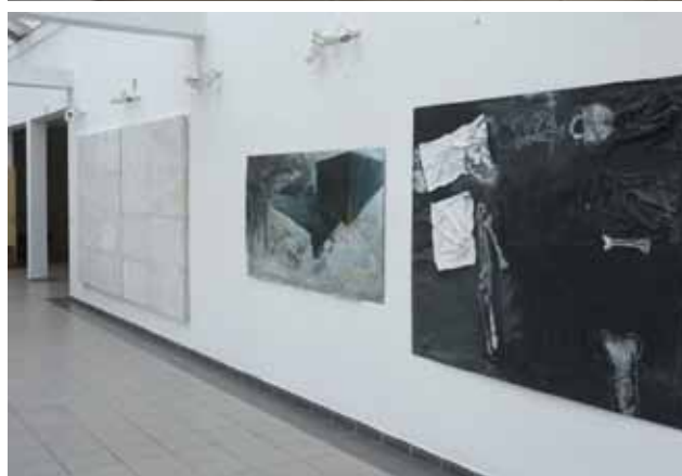
FRAGMENT EKSPOZYCJI W HOLU ISW-MALARSTWO Z PRACOWNI AD. NORMANA SMUZIŃSKA, W GŁĘBI - PRACA AUTORSTWA AD. ZENONA POLUSA