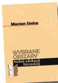
SINICA M., Wybrane obszary badań edukacji literackiej, s. 268, oprawa twarda, 15 x 21 cm, Oficyna Wydawnicza UZ, 2006

Przedstawiona publikacja jest wyborem teoretyczno-metodologicznych rozpraw i relacji z badań mieszczących się w polu zainteresowań autora.