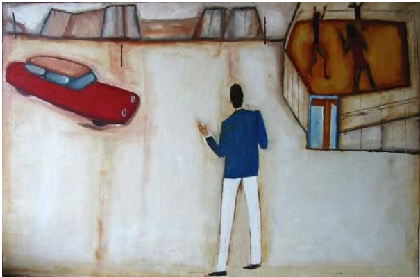
JERZY NOWOSIELSKI - „PEJZAŻ FANTASTYCZNY”