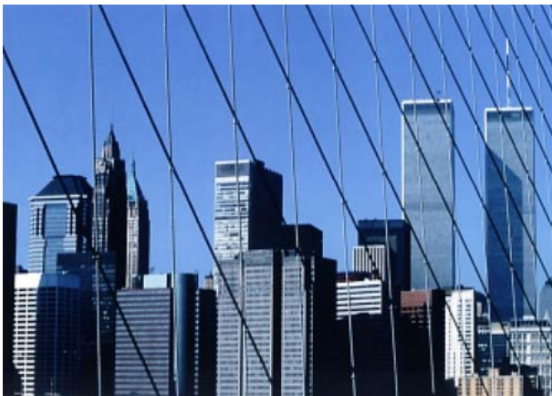
CZESŁAW CZAPLIŃSKI - „NOWY JORK - PRZED I PO 11 WRZEŚNIA”

W Muzeum w czerwcu otwarte zostaną następujące wystawy: