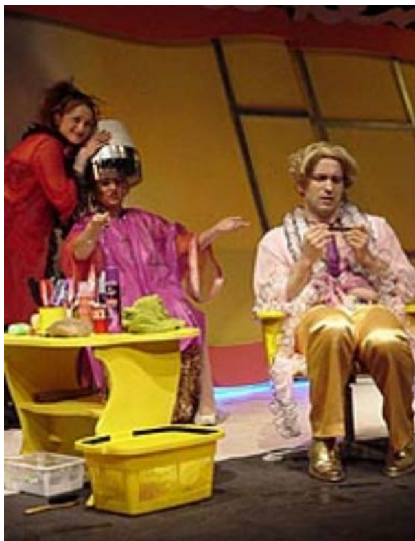
SCENA ZE SZTUKI „SZALONE NOŻYCKI”