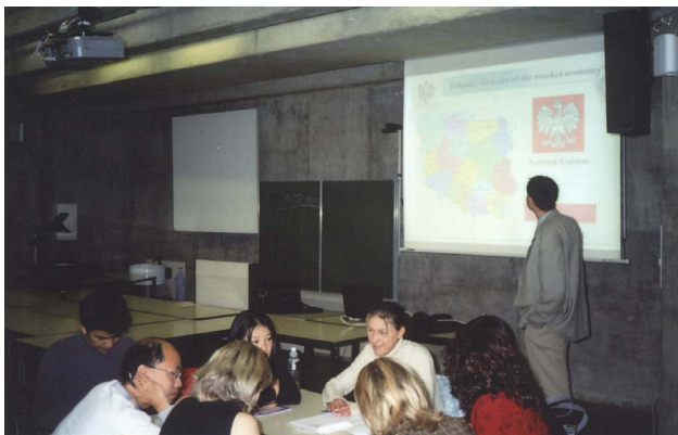
OMAWIANIE TEMATYKI PROJEKTÓW