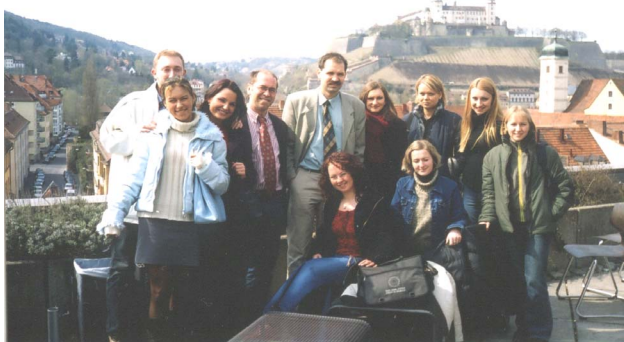
PODCZAS ZWIEDZANIA WÜRZBURGA