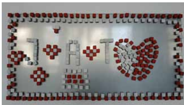
KRUCHA FLAGA - TABLICA MAGNETYCZNA, KOSTKI Z MARMURU