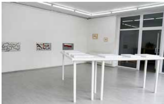
FRAGMENT WYSTAWY, FOT. KAROLINA SPIAK

Subtelność tej wystawy, a jednocześnie zawarty w niej duży ładunek emocjonalny, wiążą się z niewidocznym na pierwszy rzut oka wysokim poziomem zaangażowania artystki w analizę reguł funkcjonowania współczesności. Stworzona przez nią świetlica spełniła swoje założenia jako miejsce spotkania i próba spojrzenia na złożoność świata, w którym żyjemy. Być może stała się też ona materializacją obszaru refleksji nad dalszym ciągiem dziejów ludzkości, w którym dla przetrwania potrzebna będzie interakcja, współpraca, wspólnota intelektualna. Pozorna „łatwość” relacji z elementami wystawy