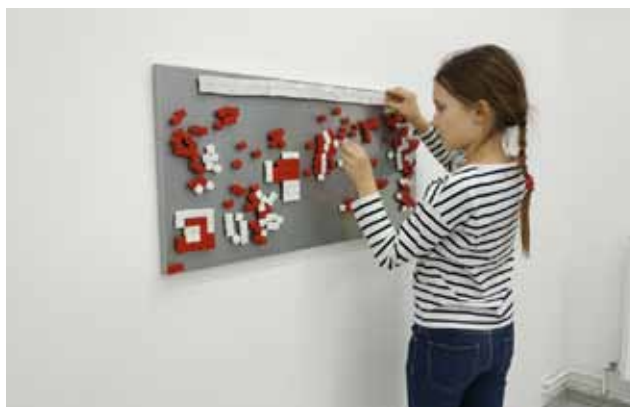
KRUCHA FLAGA - TABLICA MAGNETYCZNA, KOSTKI Z MARMURU