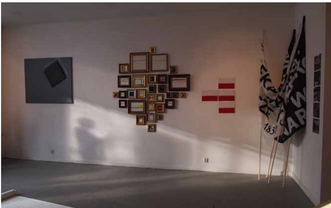
FRAGMENT EKSPOZYCJI

Transfer to wystawa prac pedagogów i studentów Instytutu Sztuk Wizualnych Uniwersytetu Zielonogórskiego. Jej otwarcie nastąpiło 18.03.2019 r. o godz. 17.00. Wystawa była czynna w dniach 19-23 marca 2019 r., ekspozycja mieściła się w Galerii Szewska, w Poznaniu, na ulicy Szewskiej 16. Jest to budynek F Uniwersytetu Artystycznego, gdzie mieści się Wydział Malarstwa UAP.