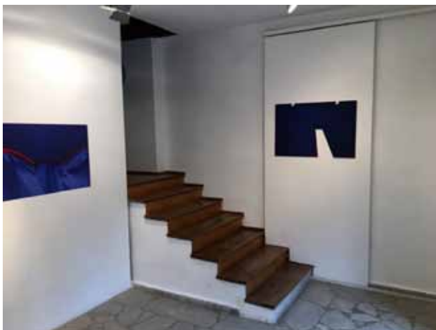
PAWEŁ ANDRZEJEWSKI, HORYZONT, GALERIA BASZTA - ZBĄSZYŃSKIE CENTRUM KULTURY, FRAGMENT EKSPOZYCJI