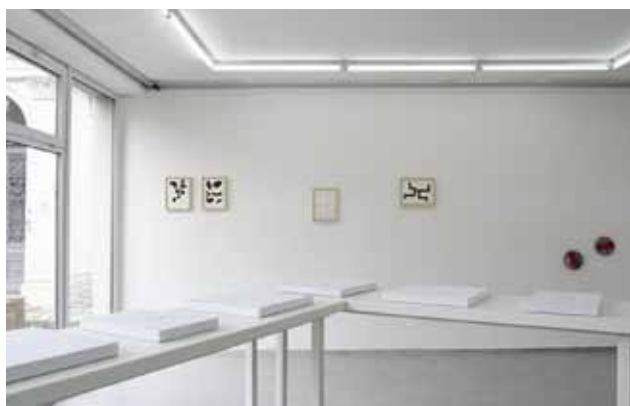
FRAGMENT WYSTAWY

wynika tu z medium, gry, która pozwala na natychmiastowe wejścia w ofiarowywany przez artystkę świat. Błędowska daje nam narzędzia, których skuteczność zależy od nas samych. Czy z nich skorzystamy i w jaki sposób, to otwarte pytania, na które nie ma oczywiście jednoznacznej odpowiedzi.