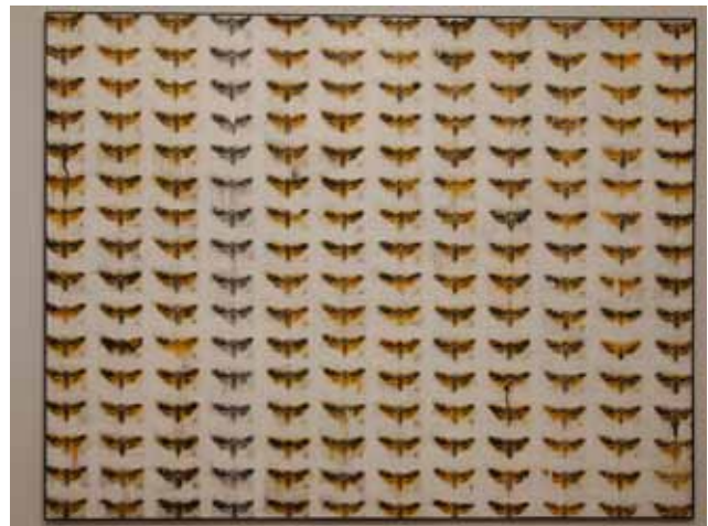
ĆMA Z ĆMY, 135 X 175 AKRYL, PŁÓTNO

(...) Prace zaprezentowane na wystawie to siedem obrazów. To ćmy, ryby, czaszki, zakryte słowa, to symbole, atrybuty, zebrane w dzieciach, powielone w nieskończoność