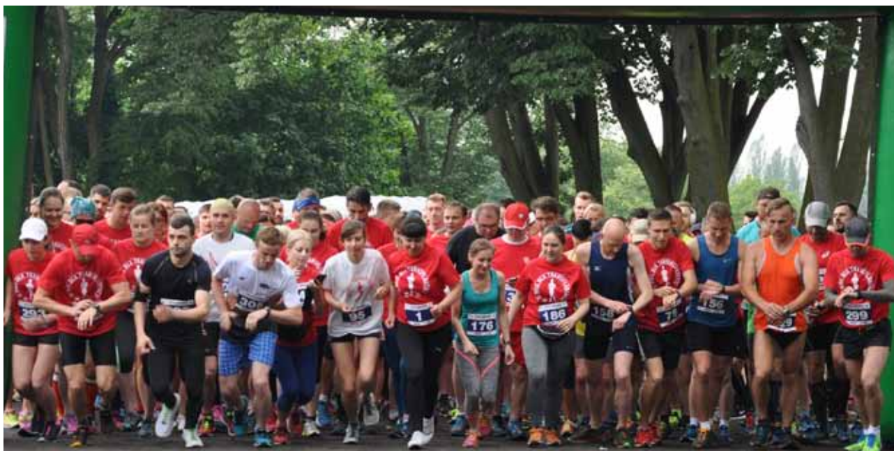
START II BIEGU DLA TRANSPLANTACJI