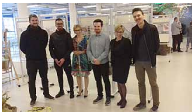
UCZESTNICZY OTWARCIA WYSTAWY