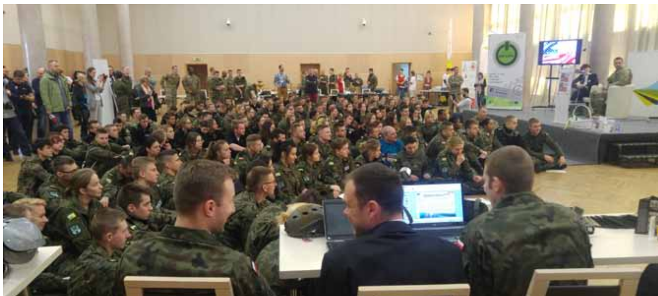
UCZESTNICZY OTWARCIA WYSTAWY