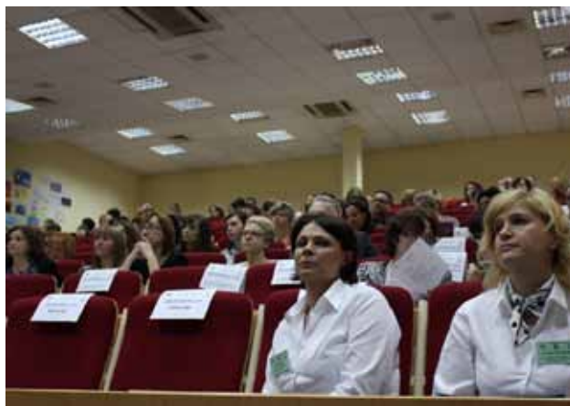
UCZESTNICZY KONFERENCJI „NIE MA DZIECKA - JEST CZŁOWIEK” PODCZAS OBRAD.