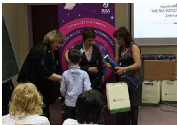
WREĆCZANIE NAGRÓD ZWYCIĘZCOM KONKURSU PLASTYCZNEGO.