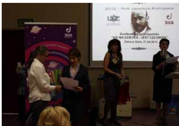
WREĆCZANIE NAGRÓD ZWYCIĘZCOM KONKURSU LITERACKIEGO.