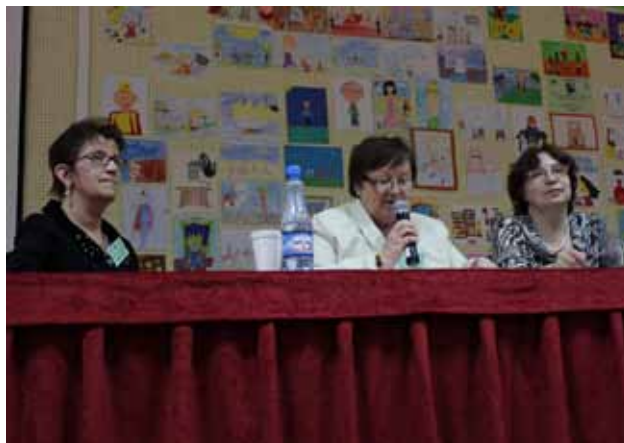
PODSUMOWANIE OBRAD W SEKCJACH DOKONANE PRZEZ PRZEWODNICZĄCYCH SEKCJI.