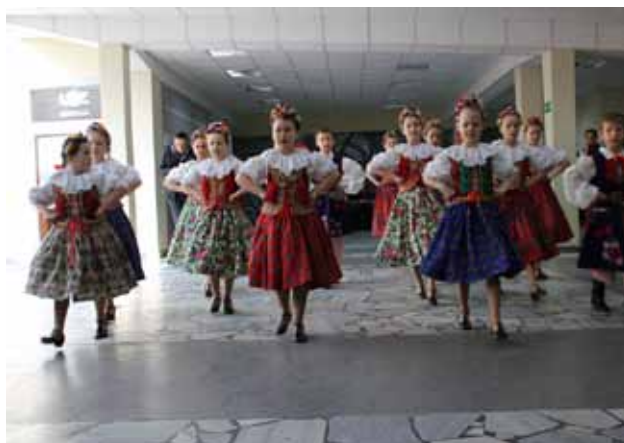
WYSTĘP ZESPÓŁU PIĘŚNI I TAŃCA „AMAKI”.