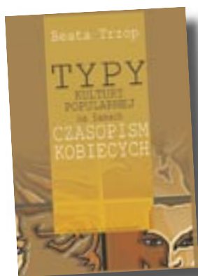
Trzop B., Typ kultury popularnej na łamach czasopism kobiecych, s 211, oprawa broszurowa, B5, Oficyna Wydawnicza UZ, 2005

Zaprezentowane typy (odmiany) kultury popularnej są wynikiem analizy wybranych tytułów prasy kobiecej, ale z pewnością mogą również dotyczyć innych wytworów kultury popularnej. Z pewnością są dowodem na to, że analiza zjawisk zachodzących w mass mediach może dostarczyć wielu interesujących rozwiązań i ukazać nieoczekiwane lub niewidoczne w pobieżnym oglądzie wzajemne relacje. O istocie badań nad współczesną kulturą popularną może świadczyć to, że po czasie wzmożonej krytyki i dyskusji opartych