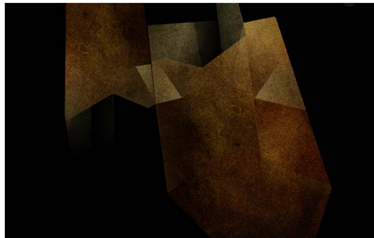
MARIUSZ DAŃSKI, Z CYKLU VANA FIGURIS – NA DWA, NA RAZ, 2012, DRUK PIGMENTOWY NA PŁÓTNIE, 100X70 CM