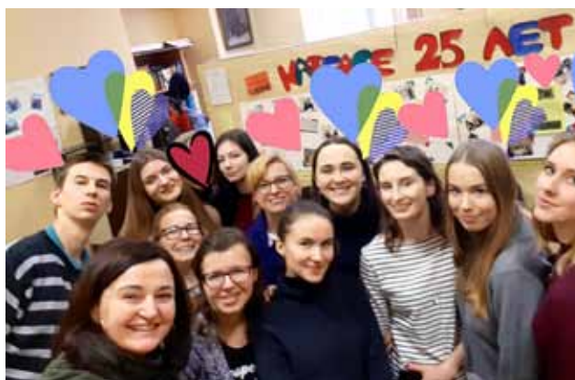
FOT. ARLETA KOPACZYŃSKA

Mimo, że harmonogram był bardzo napięty, to udało się również pojechać na jeden dzień do stolicy kraju - Moskwy. Wybierając do podróży pociąg sypialny studenci nabyli no-