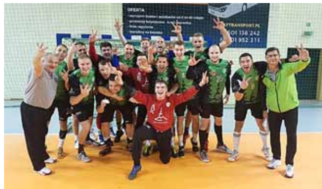
OBYWIECI TAKICH ZDIĘĆ PO MECZACH WYJAZDOWYCH. TRIUMF W ŁODZI 31:30

Z końcem sezonu satysfakcjonujące okazałyby się 6.-7. miejsce. By dopełnić celu, akademicy muszą awansować o minimum 3 pozycje. W chwili obecnej plasują się na dziesiątej lokacie, ze stratą wynoszącą osiem punktów. Do końca sezonu pozostało jeszcze osiem pojedynków.