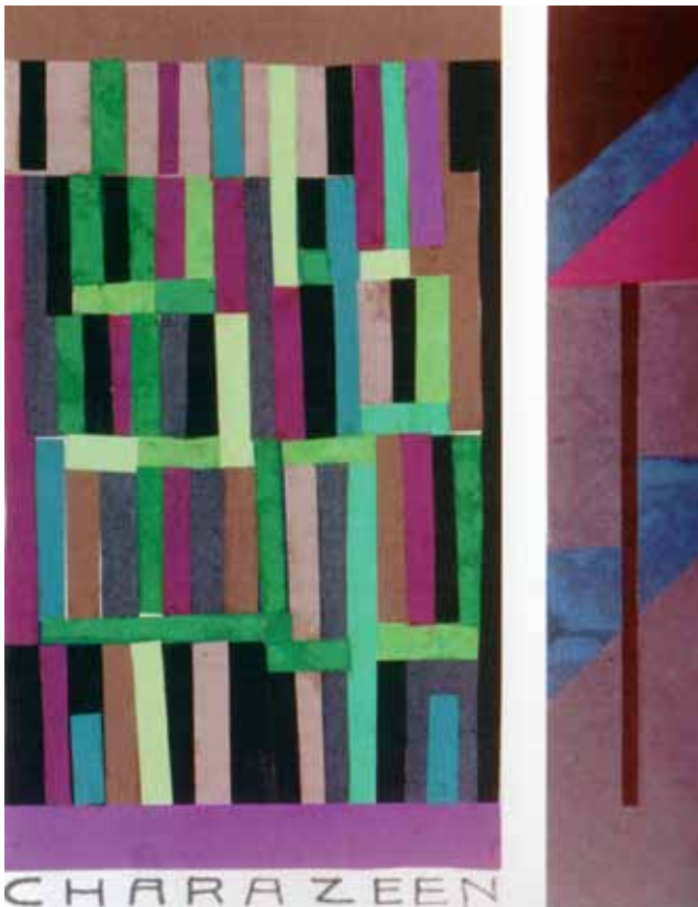
KARACENY I VIOLA ODORATA, KOLAŻE Z KSIĄŻKI ARTYSTYCZNEJ DAS PFANZENSCHICKSAL [LOS ROŚLIN], OK 1927