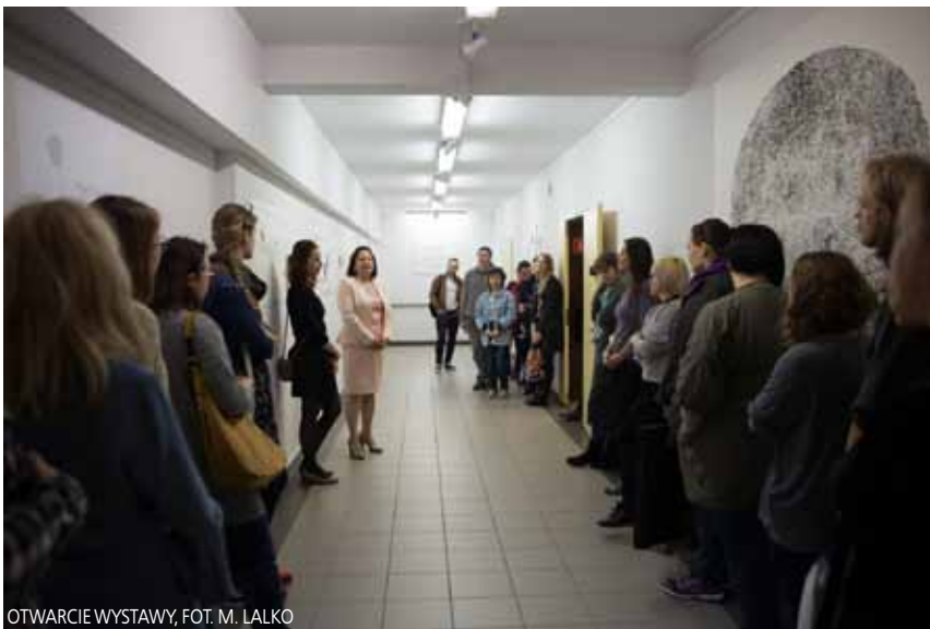
OTWARCIE WYSTAWY