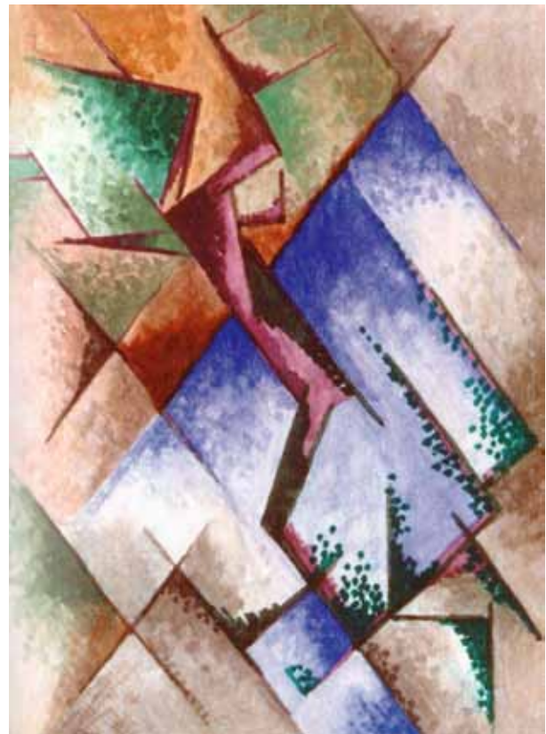
BUK III, AKWARELA Z KSIĄŻKI ARTYSTYCZNEJ WASSER , 1932