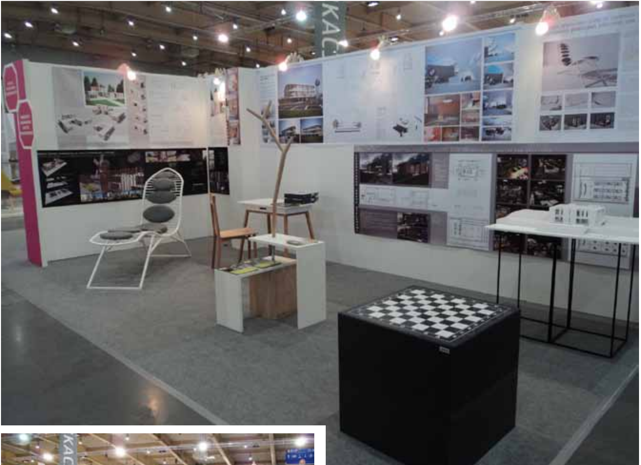
FOT. Z WYDZIAŁU

W tym roku koncepcji projektowych jest dla studentów dużym wyróżnieniem oraz ważnym wydarzeniem na początku drogi zawodowej. Instytut Sztuk Wizualnych Uniwersytetu Zielonogórskiego miał okazję uczestniczyć w tym przedsięwzięciu już po raz drugi.