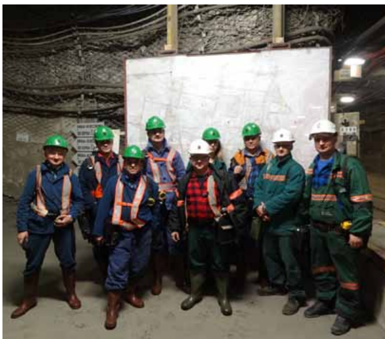
FOT. Z WYDZIAŁU