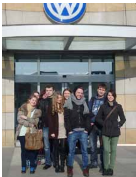
GRUPA STUDENTÓW III ROKU SOCJOLOGII PRZED WEJŚCIEM GŁÓWNYM FABRYKI VOLKSWAGEN W POZNANIU