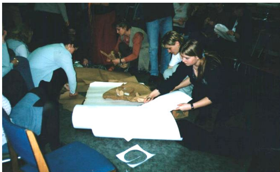
WARSZTAT: MASKA – JAKI JESTEM? JAKI CHCIAŁBYM BYĆ?