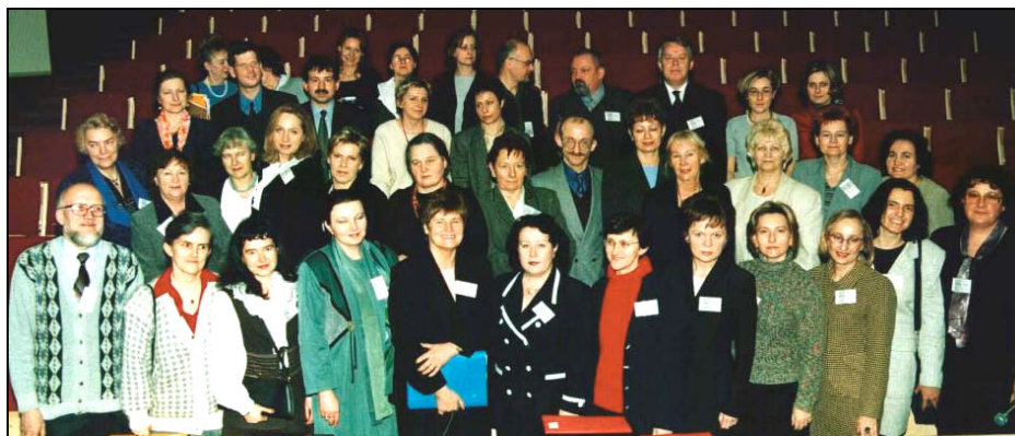
UCZESTNICY KONFERENCJI (REFERUJĄCY)