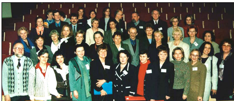
UCZESTNICY KONFERENCJI (REFERUJĄCY)