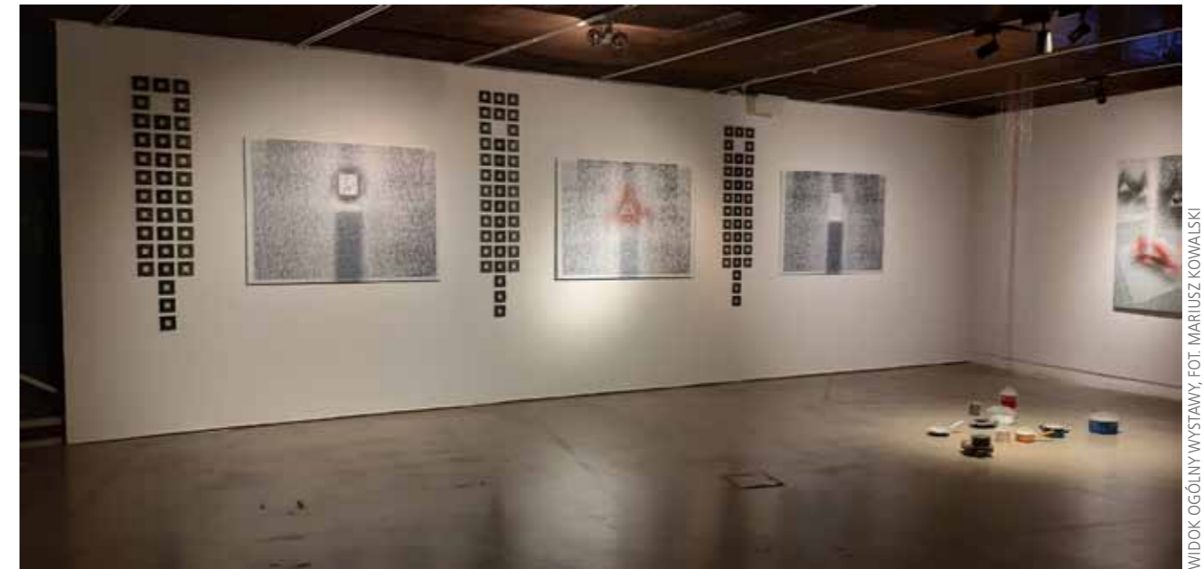
WIDOK OGÓLNY WYSTAWY