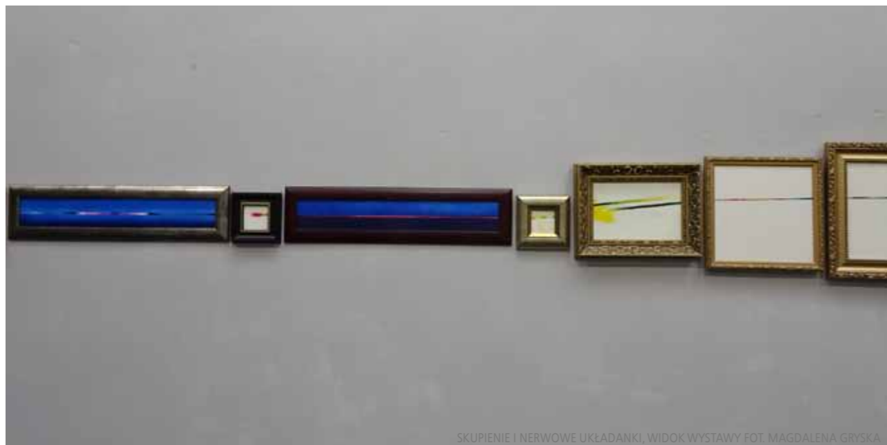
SKUPIENIE I NERWOWE UKŁADANKI, WIDOK WYSTAWY FOT. MAGDALENA GRYSKA