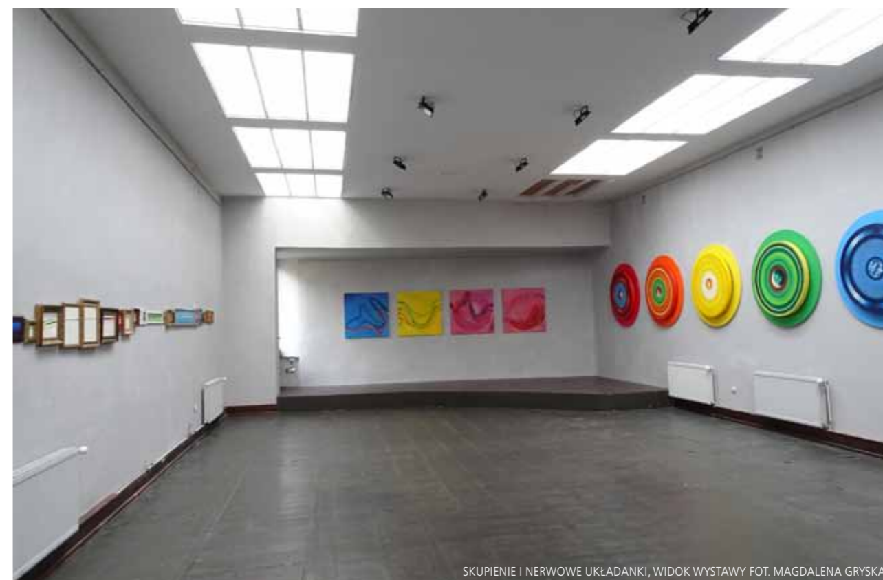
SKUPIENIE I NERWOWE UKŁADANKI, WIDOK WYSTAWY

5 rytmów - na ekspozycję Magda Gryska wybrała pięć obrazów z szerszego cyklu. To realizacja inspirowana metodą pracy Gabrielli Roth - tancerki, terapeutki, performerki, której aktywność datuje się głównie na lata 70-te ubiegłego wieku. Jej praktyki medytacyjne znalazły uznanie na świecie i stosowane są do dnia dzisiejszego. I w tym cyklu Magda Gryska skupia się na poszukiwaniu tego co nienazwane, a obecne i nierozdzielnie powiązane z naszym byciem poza kategorią fizyczności ciała. To rozważanie o równowadze między ciałem, a duchem, o balansie w życiu i umiejętności kreacji witalnej przestrzeni. Obrazy przywołują na myśl ślad wstążki jaką posługują się tancerki. Taneczna subtelność malarskiego gestu - formalne rozwiązania warsztatowe dla opisu kontemplacji ruchu, to wyżyny artystycznych dociekań. 5 rytmów to połączenie dynamiki i skupienia, rozdręgnięcia i spokoju, to wołanie o chwilę refleksji, prośba o ciszę i medytację. Pięć wyciszonych obrazów olejnych w formacie 100x100 cm stały się aranżacyjną 'klamrą', by lekko prowadzić odbiorcę do Obrazów mesmerycznych . Ten ostatni, to cykl znaczeniowo zamykający wg mnie całą ekspozycję. Podsumowuje zawarte w dwóch wcześniej wspomnianych cyklach poszukiwania 'przestrzeni niefizycznych', sięganie poza poznane i poza nazwane. Siedem olejnych obrazów na okrągłych krosnach o średnicy 130 cm odnosi się w swojej bazie znaczeniowej do hindu-