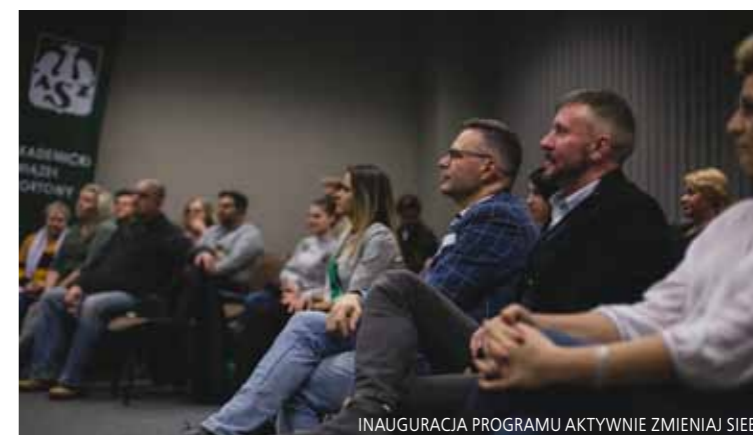
INAUGURACJA PROGRAMU AKTYWNIEM ZMIENIAJ SIEBIE