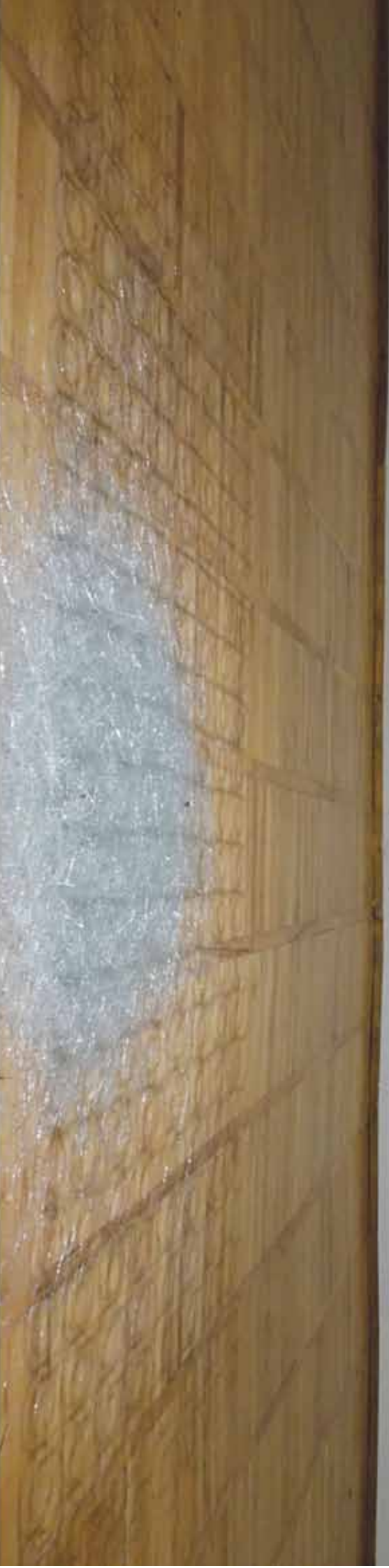
Paulina Komorowska-Birger Przejścia , Adam Romanuk Powidoki-staw , Muzeum Ziemi Lubuskiej, Galeria Nowy Wiek, fot. Janina Komorowska