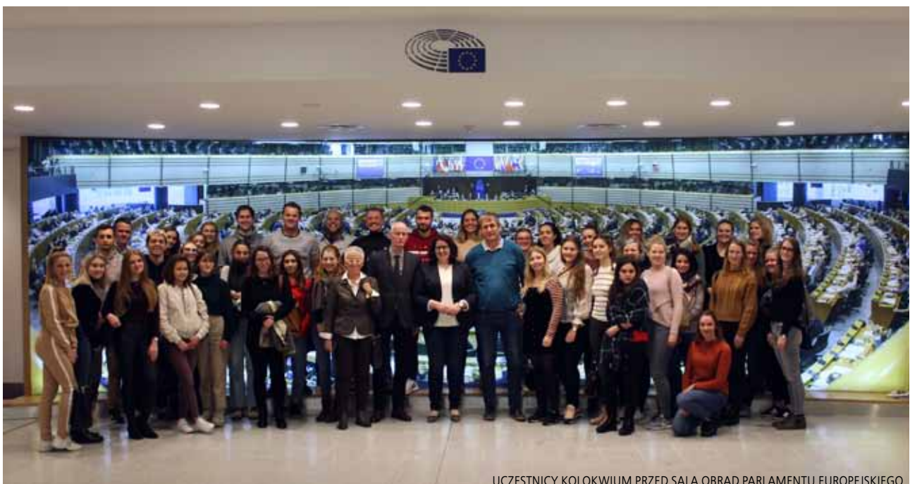
UCZESTNICY KOLOKWIIUM PRZED SALĄ OBRAD PARLAMENTU EUROPEJSKIEGO

Pobyt w Brukseli uwieńczony został koncertem w pięknej secesyjnej sali filharmonii oraz wystawą Bruegla, która nie pokazując oryginalnych prac mistrza, uczy patrzenia na sztukę poprzez multimedialną projekcję dzieł artysty na dużych ekranach z towarzyszącym projekcji dźwiękiem. Taka dość niekonwencjonalna ekspozycja artystyczna, niestanowiąca tradycyjnego kontemplowania płócien w muzeum, zrobiła na wszystkich młodych przecieź uczestnikach wielkie wrażenie. Bruksela stała się więc ważnym punktem na mapie miejsc, w których do tej pory przez 29 lat zorganizowano Polsko-Francusko-Niemieckie Kolokwia, ponieważ umożliwiła zaakcentowa-