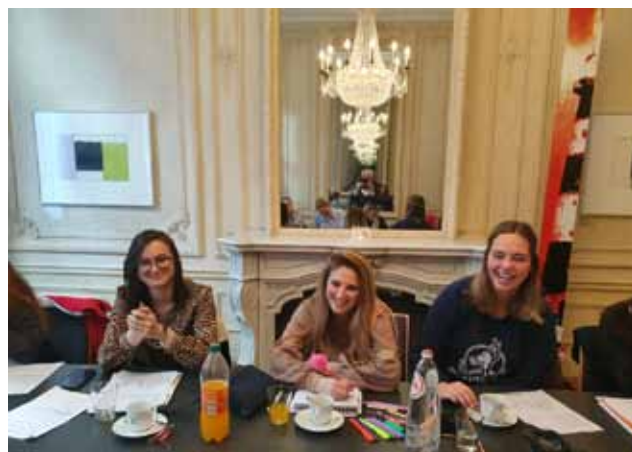
PRACA W GRUPACH