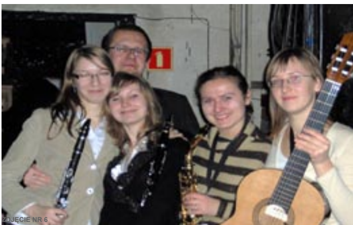
ZDJĘCIE NR 6