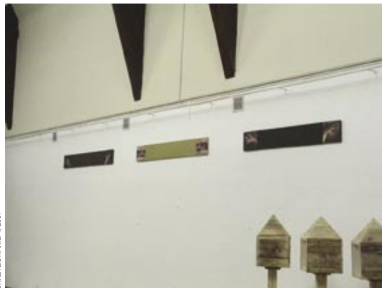
UKRZYŻOWANIE I, 2001