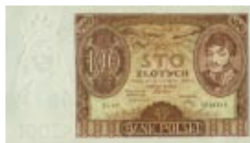
100 zł z 1932 roku awers